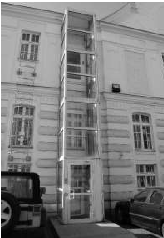
Rys. 8. Przeszkłona dobudowa do budynku zalepca platformy dla osób niepełnosprawnych z początku XXI wieku