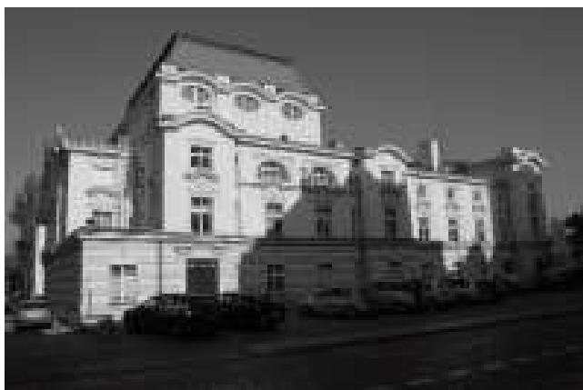
Rys. 3. Widok na gmach teatru od strony południowej