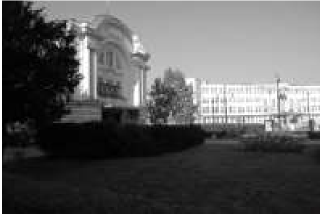
Rys. 12. Zachodnia część Placu Teatralnego z obiektami Teatru im. Wilama Horzycy i Urzędu Marszałkowskiego