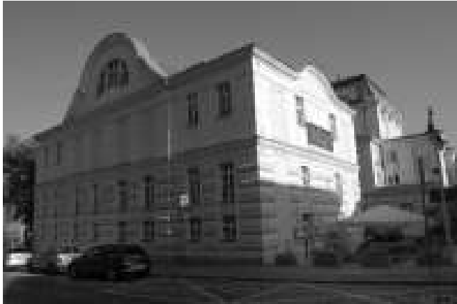
Rys. 5. Budynek zaplecza teatru im. Wilama Horzycy w Toruniu – ujęcie od strony południowo-zachodniej. Po prawej stronie obniżenie wejścia głównego do obiektu. W głębi widoczny budynek główny