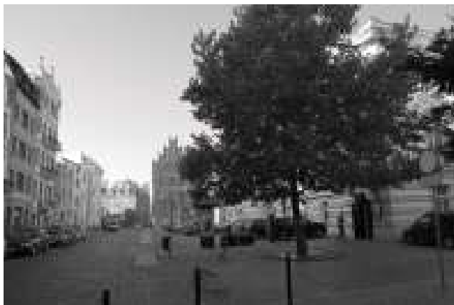
Rys. 7. Ulica Fosa Staromiejska w Toruniu – w posadzce uczytelniono zarys fragmentu przebiegających tu w przeszłości murów obronnych. Po prawej stronie budynek teatru