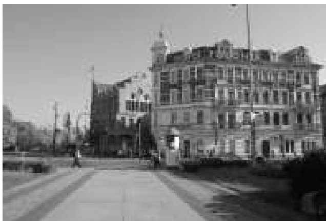
Rys. 10. Widok na pochodzące z 1901 r. budynki: Urząd Miasta Torunia (po lewej) i (po prawej) Hotel Polonia

Po odzyskaniu niepodległości w 1920 r. Toruń został wybrany na stolicę województwa pomorskiego. W sąsiedztwie teatru, poza rozebraniem obelisku, zlikwidowany szybko został wewnętrzny pas forteczny oddzielający starówkę od przedmieść. Zburzono przy tym bramy i zasypano fosy. Dalsze istotne zmiany nastąpiły po tym, jak sprawy urbanistyki Torunia powierzone inżynierowi Ignacemu Tłoczkiowi. Jego, wykonany w latach 30. XX w. plan zagospodarowania przestrzennego był śmiałym i, jak się okazało po latach, bardzo trafnym opracowaniem, na podstawie którego, również po II wojnie światowej, tworzone idee dalszego rozwoju przestrzennego. Jedną z inwestycji, powstałych na podstawie wizji Ignacego Tłoczki była budowa tzw. obwodnicy staromiejskiej na zachodniej oraz północnej granicy śródmieścia – ciąg ulic Wały Gen. Sikorskiego i Dąbrowskiego. Idea polegała na budowie wokół centrum dzielnicy urzędów i biur w przestrzeni w dużej mierze zielonej, na dawnych terenach fortyfikacji. Na przełomie lat 20. i 30. dwudziestego wieku wzniesiono wiele gmachów użyteczności publicznej w tym rejonie, a chyba największym z nich był budynek Dyrekcji Okręgowej Kolei Państwowych (po wojnie mieściło się w nim Prezydium MRN, później Urząd Wojewódzki, a obecnie Urząd Marszałkowski Województwa Kujawsko-Pomorskiego). Obiekt o wyraźnych cechach modernizmu został zaprojektowany przez arch. Franciszka