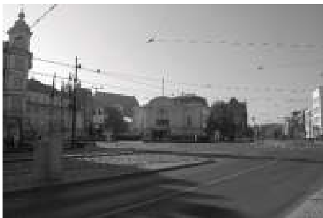
Rys. 14. Widok na Plac Teatralny i budynek teatru od strony wschodniej

zbadaniu tematu, jest kwestia zagospodarowania w sposób spójny i atrakcyjny samego placu. W tej chwili pełni on przede wszystkim rolę komunikacyjną. Powinna ona zostać ograniczona celem udostępnienia tej przestrzeni w większym stopniu pieszym. Warto też rozważyć zaproponowanie nowego pomnika, który byłby korzystny dla kompozycji urbanistycznej, a nie wiązałby się przy tym z określoną ideologią. Widok na Plac Teatralny i budynek teatru od strony wschodniej przedstawiono na rysunku 14. Co do zespołu obiektów Teatru im. Wilama Horzycy w Toruniu, to najkorzystniej byłoby, aby przyszłe ingerencje ograniczyć do minimum. Podobna uwaga zresztą tyczy się całego zespołu staromiejskiego w Toruniu, gdyż większość nowych ingerencji bezpowrotnie zmienia jego obraz 21 . Przy ewentualnych dalszych przekształceniach opisanych w tekście budynków i placu warto korzystać z osiągnięć polskiego konserwatorstwa 22 .