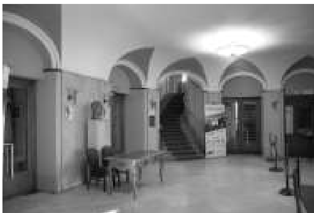
Rys. 4. Reprezentacyjny westybul budynku głównego