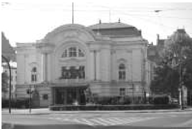
Rys. 2. Widok fasady frontowej budynku Teatru im. Wilama Horzycy w Toruniu