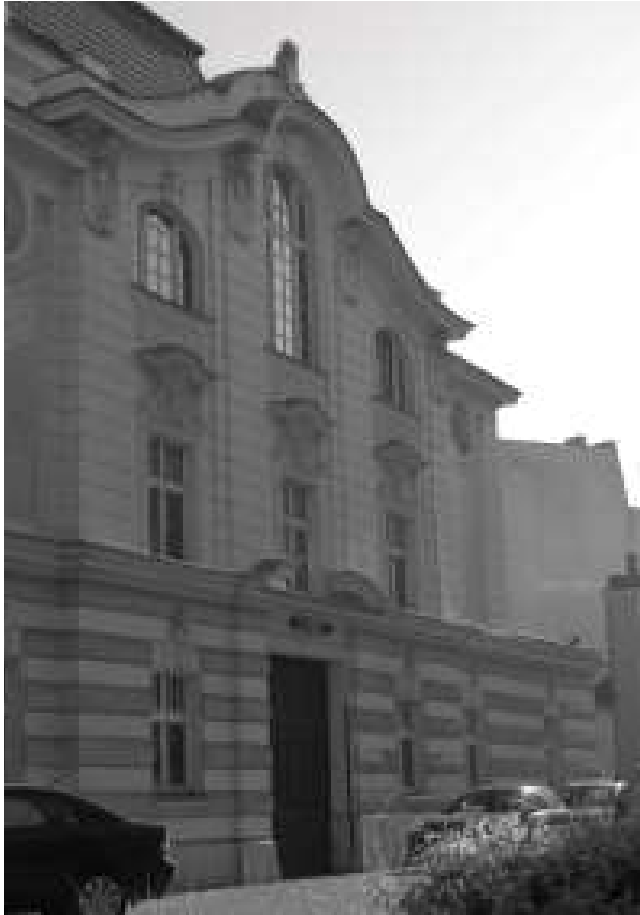
Rys. 9. Tylna elewacja budynku teatru. Widok od strony północno-zachodniej [fot. autor]