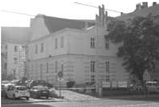
Rys. 6. Budynek zaplecza od strony północnej