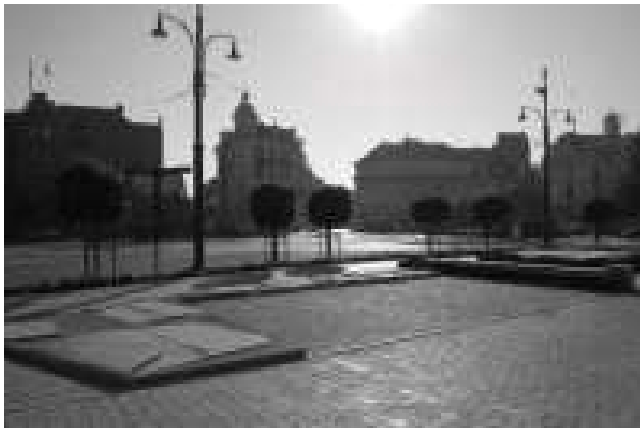
Rys. 13. Widok od strony północnej na Plac Teatralny w Toruniu