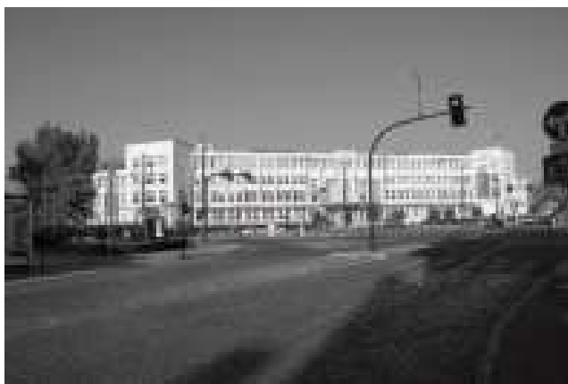
Rys. 11. Zmodernizowany gmach Urzędu Marszałkowskiego w Toruniu